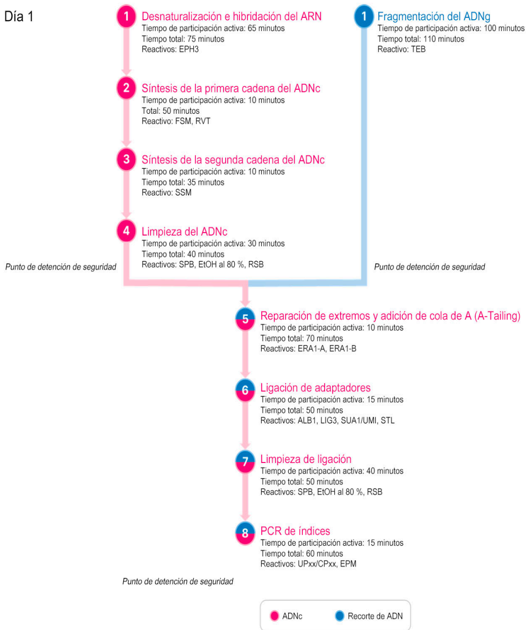
Figura 1 Flujo de trabajo de TSO Comprehensive (UE) (parte 1)

* Los tiempos de participación activa y los tiempos totales son aproximados.