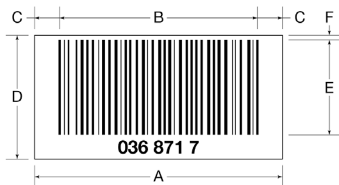
Figur 2 Strekkodedimensioner