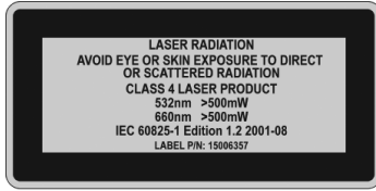
Figure 1 Class 4 Laser Warning