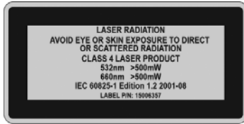
Abbildung 1 Warnhinweis zu Lasern der Klasse 4